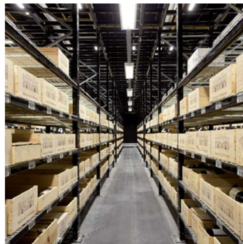
espace de stockage en bouteille