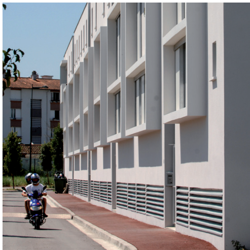
façade sur rue