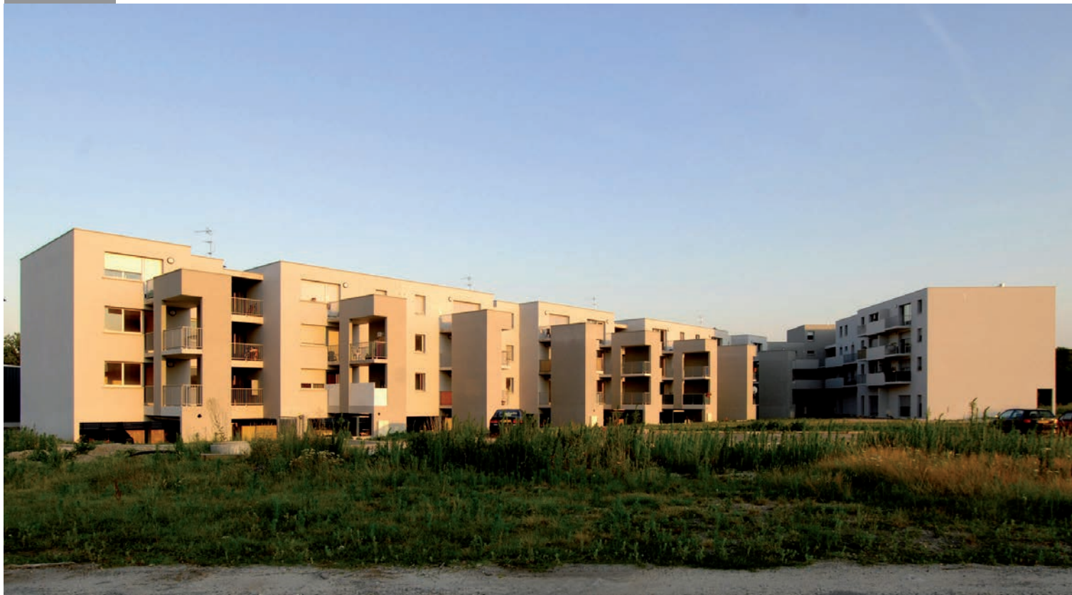
vue sur cœur d'îlot