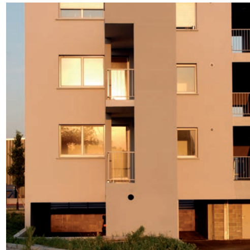
terrasses = pièces extérieures